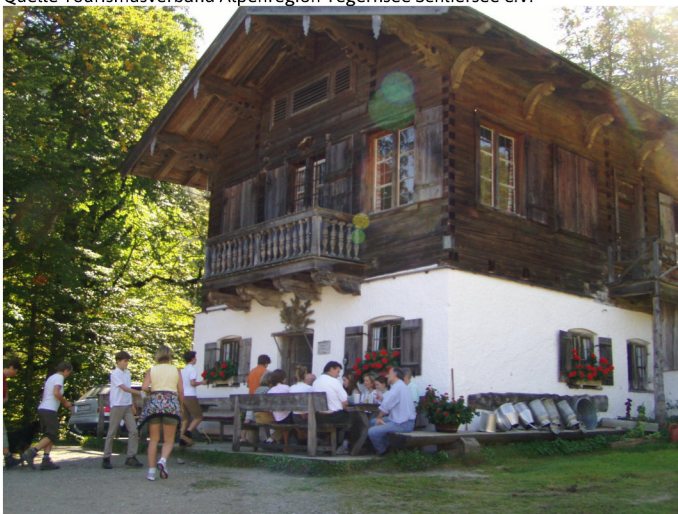
Königsalm Autor Unbekannt Quelle Tourismusverband Alpenregion Tegerensee Schliersee e.V.