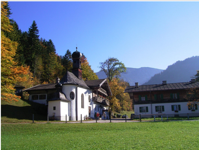
Wildbad Kreuth Autor Unbekannt Quelle Tourismusverband Alpenregion Tegerensee Schliersee e.V.