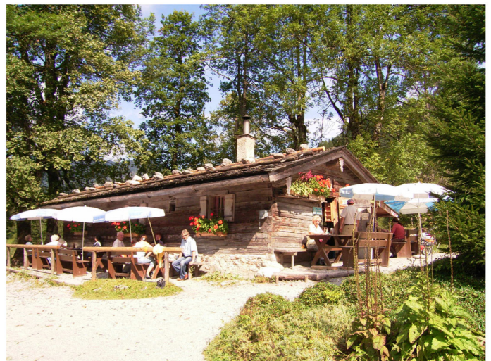
Siebenhütten Autor Unbekannt Quelle Tourismusverband Alpenregion Tegerensee Schliersee e.V.