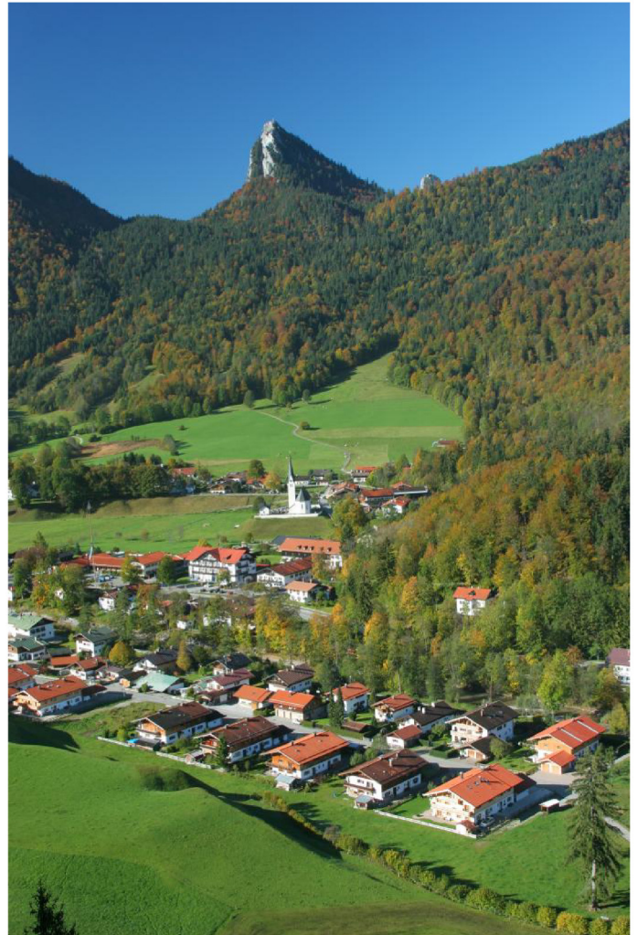
Kreuth Autor Unbekannt Quelle Tourismusverband Alpenregion Tegerensee Schliersee e.V.